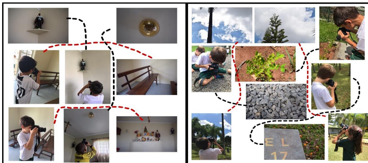
Figura 3: Montagem produzida pela autora

Fonte: Atravessamentos visuais e arteiras infâncias (DURAN, 2020, p. 24)