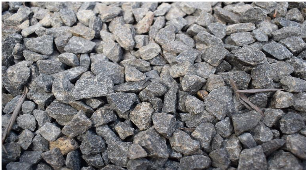
Figura 1: Fotografia produzida pelas crianças durante oficina