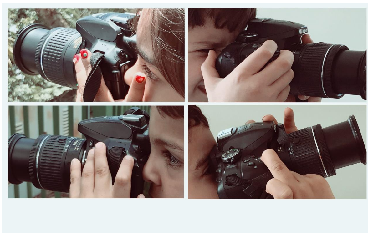
Figura 5: Montagem produzida pela autora

Descobri que quando pisamos no chão da infância é preciso abandonar a rigidez do método, as análises, as tais coletas de dados. E é preciso não ter medo do caos, andar na corda bamba e aceitar os desequilíbrios, as quedas, os dados sujos, aquilo que não conseguimos acessar, aquilo que não sai como planejado, aquilo que inventamos porque pesquisar é inventar , não existe um olhar neutro, mas visualidades criadas e recriadas. E não é possível alcançar a experiência da infância sem uma disposição à experimentação. Pesquisar com crianças é se encontrar com o desconhecido , é dançar no território movente da imprevisibilidade , é assumir o olhar disperso, é ouvir e não exigir a fala, é sentir o mundo pelos sentidos , é o tempo todo se esforçar para deixar durar a infância que se inventa ali.