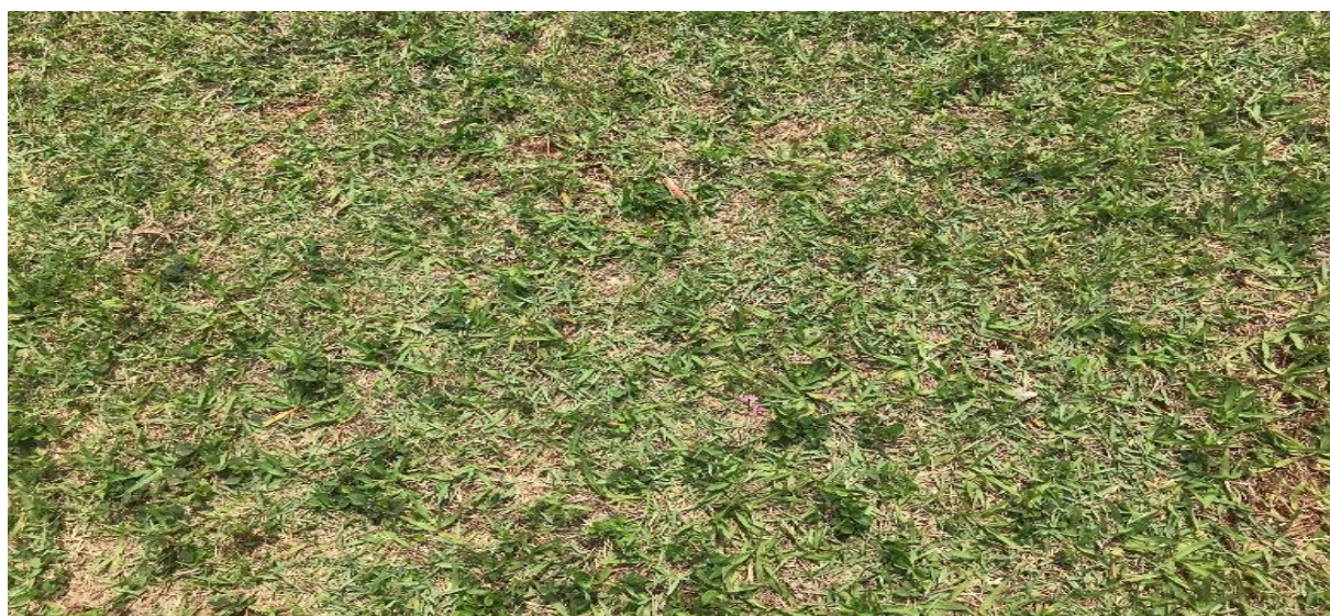
Figura 2: Fotografia produzida pelas crianças durante oficina

A busca pelo sentido cessou, poderíamos ter insistido – muitos insistem – porém o sentido seria nosso e jamais alcançaria a experiência de infância vivida ali.