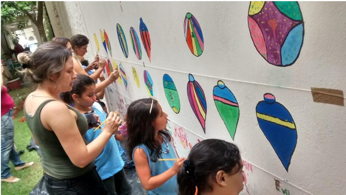
Figura 2: Atividade de pintura do poema – Fonte: Arquivo pessoal, 2014.

No decorrer da atividade, o muro como suporte para a leitura de poesia provocou um deslocamento de uma compreensão leitora que se deu inicialmente com a leitura do poema impresso, de modo individual, para a manifestação coletiva dos sentidos dados pelo sujeito leitor, criando um espaço de interação, troca e negociação sobre o que representar na pintura. No dia seguinte, concluída a atividade de pintura do muro pelas crianças, foi passado selante sobre a pintura para preservá-la dos efeitos do sol e da chuva e, assim, garantir a durabilidade da pintura do poema no muro até que se faça outra atividade poética no muro, como o trabalho feito, posteriormente, meses depois deste primeiro, de leitura e ilustração de lendas amazônicas.