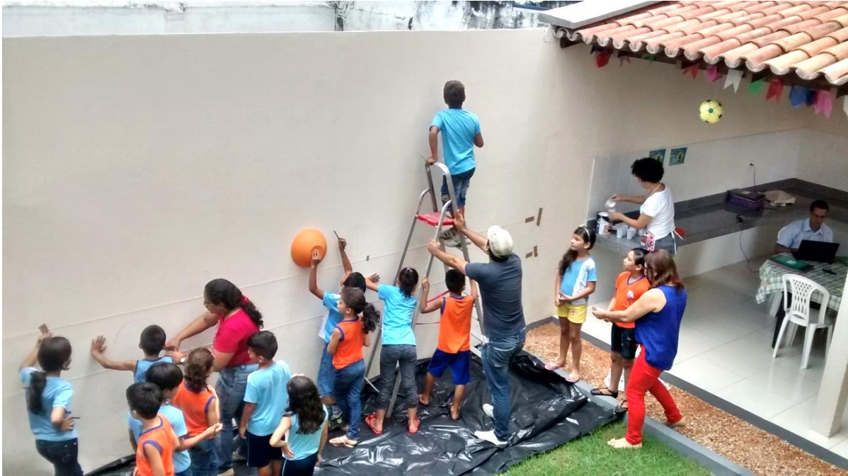
Figura 1: Planejamento da pintura no muro

A atividade de pintura (Figura 2), mediada pela professora da turma e formadores do Centro de Formação, na manhã de 25 de junho de 2014, envolveu quinze crianças do 3º ano do Ensino Fundamental, de uma escola pública municipal de Belém. Essa atividade foi desenvolvida em oito etapas: (1) roda de conversa sobre a proposta do muro; (2) apresentação do material de pintura; (3) organização dos elementos da poesia no espaço do muro; (4) desenhos de bolas, pipas e piões em moldes; (5) desenhos espontâneos ilustrando o poema; (6) escrita de trechos do poema no muro; (7) escrita dos nomes dos autores da pintura; (8) apreciação da pintura no muro pelas crianças. Nas atividades, prevaleceram o prazer e a liberdade de expressão, inerentes à imaginação que a leitura do poema instigou.