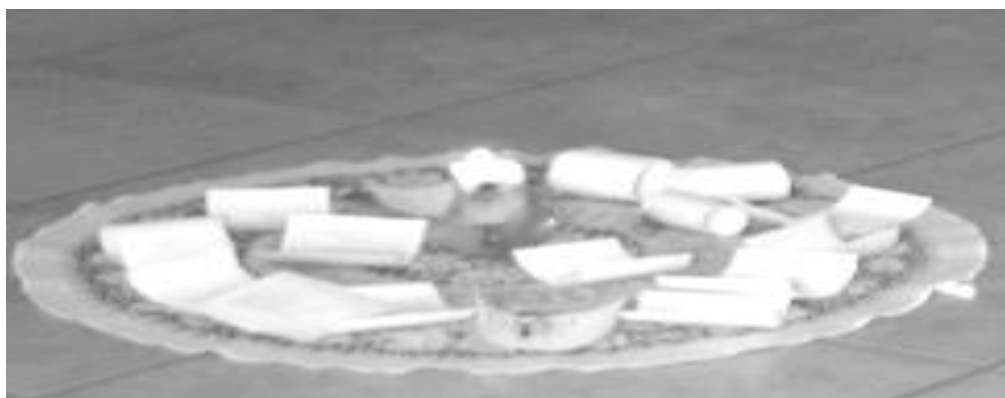
Figura 2: Centro para as danças, montado durante as oficinas

Passo 4: descalças, após passarmos uma caixa surpresa repleta de poemas impressos de variados temas/autores e autoras, cada participante compartilhou o poema que retirou da caixa. Conforme acabavam a leitura, colocavam o papel no centro da roda (figura 2), próximo à vela, para compô-lo. Nas danças circulares, é de práxis um centro. Essa linguagem dançante, traz da sua origem medieval, pessoas compartilhando, de mãos dadas com passos ligeiros e saltitantes, o movimento cíclico da vida sobre à Terra.