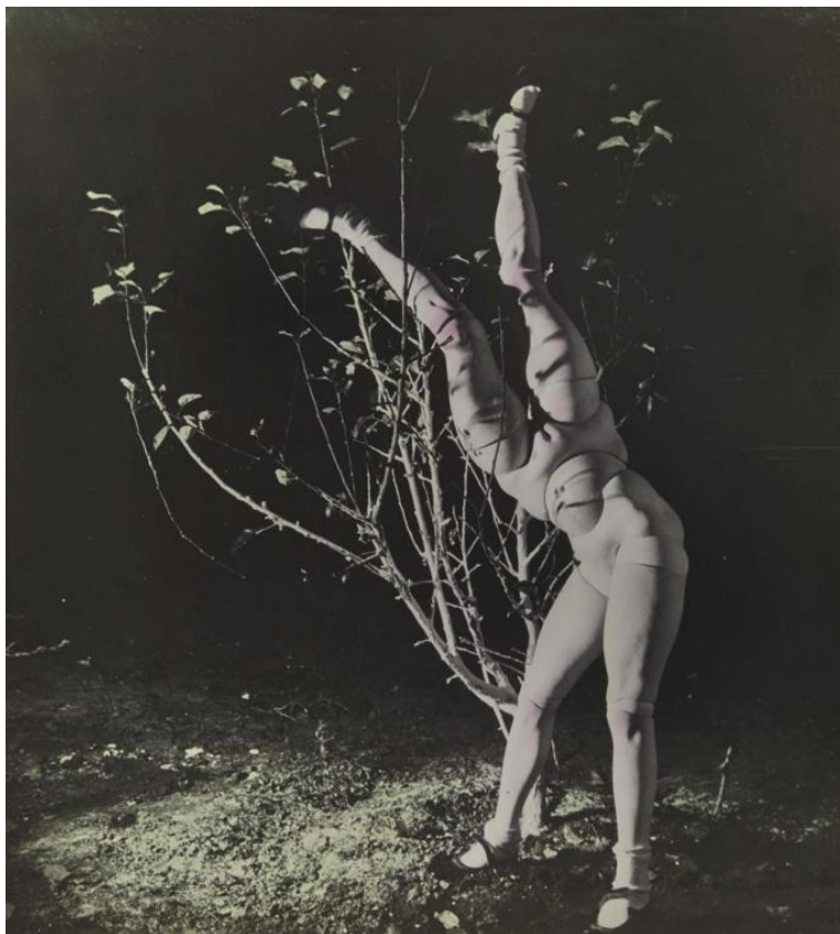
Figura 2 - La poupée ("The dool"), 1935