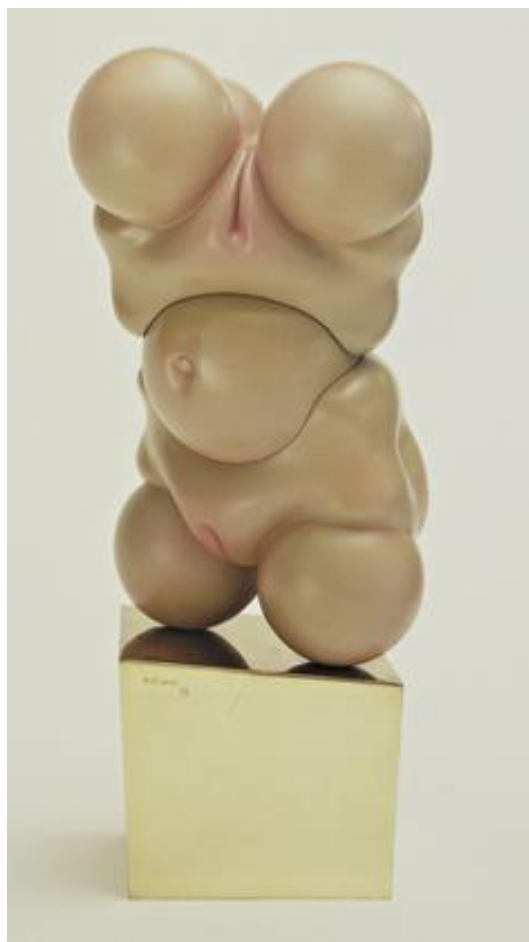
Figura 3: Doll, Paris (1936)