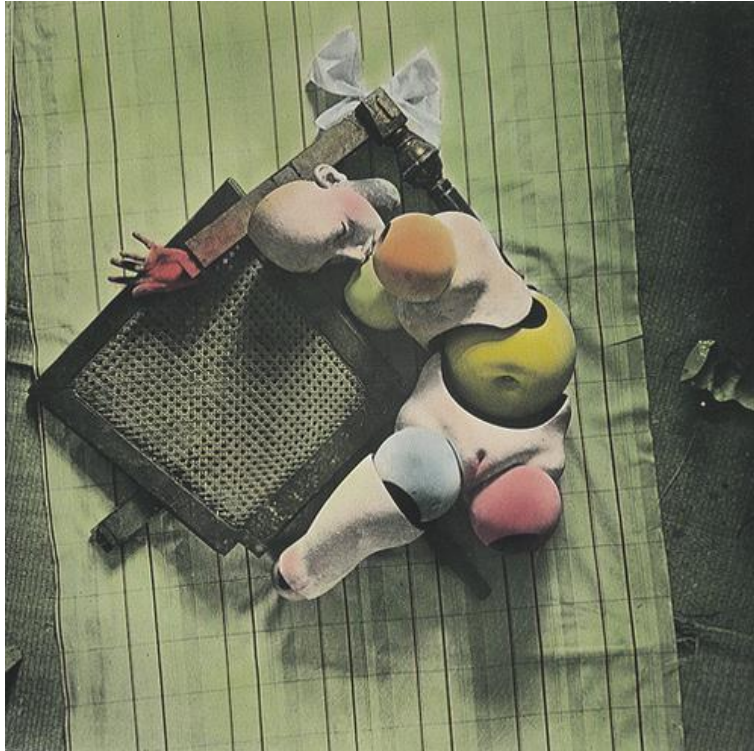
Figura 1 - La poupée, 1935-1949

Fonte: https://br.pinterest.com/pin/436989970085952420