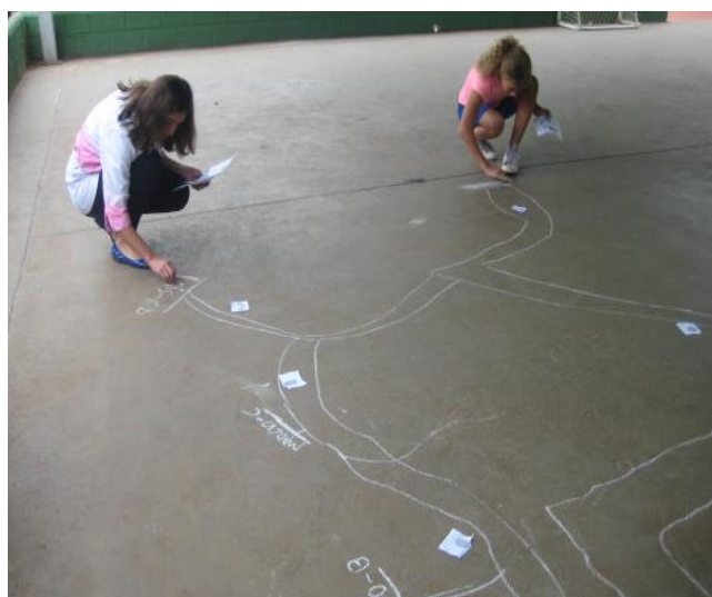
Figura 2. Mapa desenhado por um dos grupos na atividade “A Grande Corrida dos Clados”.

Ao invés de reconstruir o mapa diretamente numa folha de papel, os alunos fizeram a reconstrução no chão da quadra coberta da escola (Figura 2). Eles receberam também os carimbos impressos separadamente para irem marcando as estações e depois passaram o mapa construído para uma folha de papel (Figura 3).