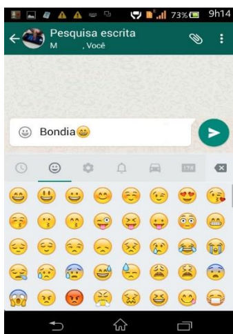
Figura 1- Escrita da palavra bom dia .

Inicialmente, T desconhecia os aplicativos presentes no celular com função para escrever e dialogar com o outro. Mergulhado no mundo digital e na interação com a pesquisadora, ele vai aos poucos descobrindo as inúmeras funções presentes neste aplicativo. Portanto não é necessário primeiro ensinar a criança a utilizar os instrumentos digitais, porque ela aprende as funções e os gestos específicos de cada instrumento ou aplicativo, quando inserida mesmo em situações discursivas. Essa atitude didática se contrapõe a ideias tradicionais presentes em práticas escolares, pelas quais inicialmente é preciso aprender sobre a linguagem escrita ou aprender a usar determinados instrumentos para, posteriormente, utilizá-los. A pesquisadora dá sugestões de como T poderia iniciar o diálogo com sua interlocutora, uma vez que demonstra receio em escrever. Após as sugestões, decide escrever bom dia . (Figura 1).