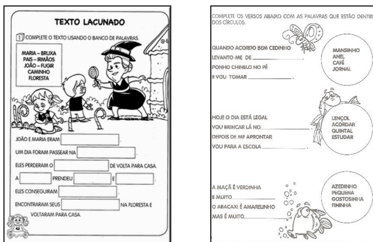
Figura 1: Atividades de produção de texto 1º ano A e 2º ano B

No 1º ano do ensino fundamental a ênfase foi em atividades que não exigiam do aluno uma produção escrita propriamente dita, apenas a reprodução de palavras, ou seja, os alunos tinham que identificar no contexto das frases qual palavra dada encaixava-se melhor. Esse tipo de proposta compreendeu cerca de 80% das atividades aplicadas no primeiro ano do ensino fundamental. Essas atividades foram intituladas pelas professoras de “textos lacunados”: