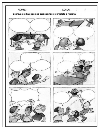
Figura 6: Atividade de produção de texto do 2º ano B

Por fim, nos deparamos com 2 propostas de textos em diálogos, no geral, histórias em quadrinhos.