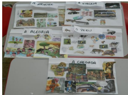
Painel criado pelas crianças.