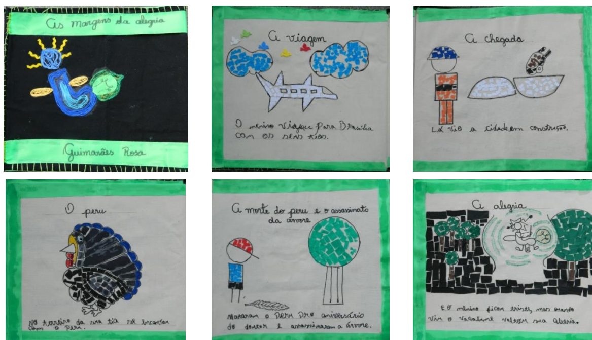
O livro de pano confeccionado pelas crianças do 3º ano a partir da narrativa de As margens da alegria.