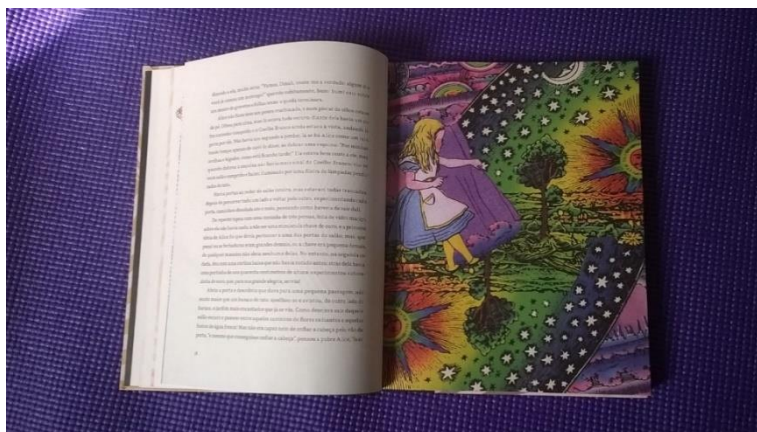
Figura 5: ilustração por Adriana Peliano. (Fonte: CARROL, 2015, p. 19).