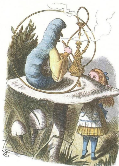
Figura 4: ilustração por Jonh Tenniel. (Fonte: CARROLL, 2013, p. 32).

Quem é você? perguntou a lagarta. Não era um começo de conversa muito animador. Alice respondeu, meio encabulada: eu mal sei, Sir, neste exato momento... pelo menos sei quem eu era quando me levantei esta manhã, mas acho que já passei por várias mudanças desde então. (CARROLL, 2002, p. 45).