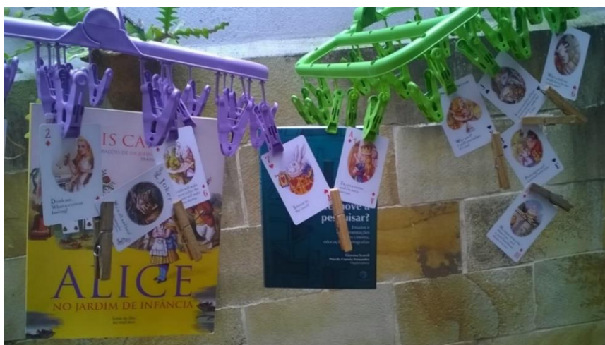
Figura 6: experimentação de Heloisa.

A questão é saber quem vai mandar. Quem manda pode então dar o significado. Nesse trabalho estamos rastreando Alices. A história é classificada como nonsense – sem sentido. Estamos vendo em Alice polisenses – muitos sentidos. Nós é que mandamos. Nós que inventamos os sentidos. Alice se apresenta para nós como trans-aberta, pode tornar-se, pode devir.