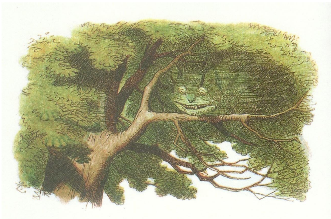
Figura 1: ilustração por Jonh Tenniel. (Fonte: CARROLL, 2013, p. 40).

Estamos caminhando, construindo nosso mapa, nossa travessia. O lugar de chegada não sabemos ao certo, não é pré-determinado. A pesquisa com a cartografia se constrói no caminho, na travessia, no encontro, na aventura. É preciso andar bastante, não há um caminho certo ou errado. Estamos ocupando o território: