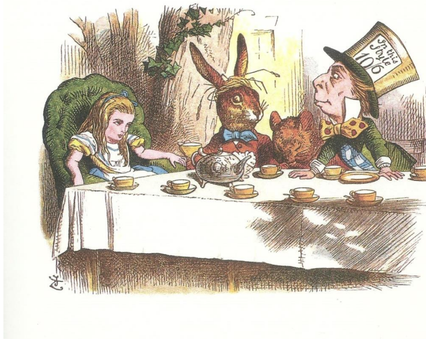
Figura 2: ilustração por John Tenniel. (Fonte: CARROLL, 2013, p. 43).

As histórias de Alice contam com elementos do cotidiano do autor. Charles era professor de matemática, e com Alice, fez uma crítica aos costumes de sua época e seu cotidiano, usou seus conhecimentos científicos para criar um mundo “sem pé nem cabeça”, classificado com nonsense-“sem sentido”. A princípio a história de uma menina que segue um coelho que usa colete, tem um relógio de bolso e corre por dizer estar atrasado, cai em uma toca, encontra seres como um gato que aparece e desaparece, um chapeleiro louco e uma rainha que sempre ordena cortar a cabeça de quem a contraria, realmente não faz nenhum sentido no mundo em que vivemos.