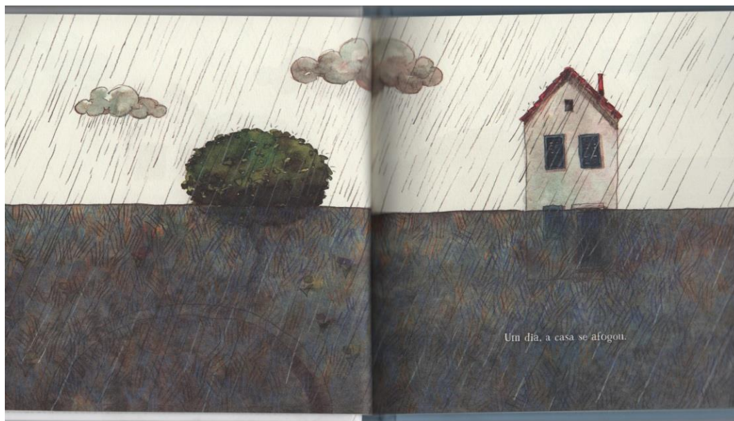
Figura 6: Página dupla do livro Lá e aqui , de Carolina Moreyra e Odilon Moraes, 2015, 1ª edição.

O livro ilustrado não só lida com cores/traços, não se define pela preocupação do ilustrador em dar a imagem, o estatuto antes exclusivo ao texto; ele também se faz/configura no uso das páginas duplas em que a ilustração se esparrama, se complementa, se contrapõe. A imagem não cabe em uma única página, como vemos nas Figuras 7 e 8 do livro Lá e aqui . A importância dada ao lugar que a imagem ocupa na página para criar um efeito "na virada da página" é um recurso próprio da contemporaneidade na história do livro ilustrado.