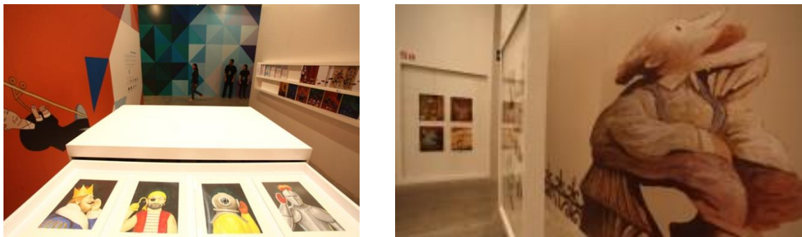
Figura 9: Imagens selecionadas de livros ilustrados para compor a exposição da história – Um panorama do livro ilustrado no Brasil (2011)

De acordo com Vilela (2011, s/p) 11 , a primeira decisão tomada foi planejar uma exposição em que o olhar estaria direcionado para os livros ilustrados e não para as ilustrações. Nessa direção, o ponto de partida foi realizar a seleção dos livros mais representativos para compor o espaço da exposição desde a década de 1970 até o ano de 2011.