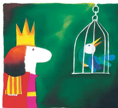
Figura 3: Página do livro O rei de quase-tudo , por Eliardo França (1971) 7