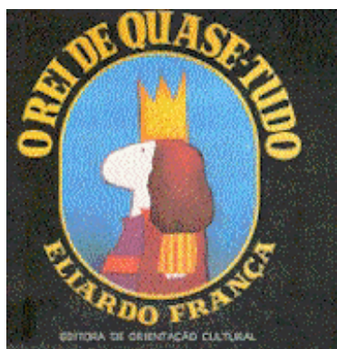
Figura 4: Capa do livro O rei de quase-tudo , por Eliardo França (1971) 6

Um dos mais importantes livros ilustrados da história da literatura infantil brasileira [...], marcou a estreia de Eliardo França no campo da autoria palavra & imagem, após alguns anos unicamente como ilustrador de cores vibrantes e traços de sincera comunicação com as crianças. A obra havia conquistado Menção Honrosa no Concurso Paz na Terra, promovido pela FNLIJ em 1972 e, uma vez publicada, viajaria à Eslováquia onde conquistou Menção Honrosa na Bienal de Ilustração de Bratislava – BIB 1975 e, no ano seguinte, em um pouso na Grécia, receberia nova Menção Honrosa durante o Congresso do IBBY em Atenas; esteve presente na Feira do Livro de Frankfurt, na Alemanha, em 1978; veio-lhe o reconhecimento da Unesco, em 1979, primeiro lugar na categoria “Livro para um Mundo Melhor”, além de festejado com vários selos de “Altamente Recomendável” [...]. (SAGAE, Dobras da Leitura, 2012, s/p). 5