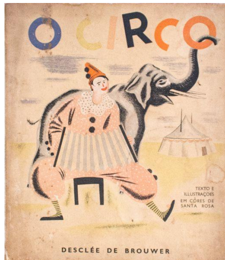
Figura 1: Capa do livro O circo , ilustrações Santa Rosa

O texto que figura na capa do livro sugere destaque ao uso de ilustrações coloridas, ao marcar: “texto e ilustrações em cores de Santa Rosa”. O livro é cartonado, com dimensões de 33 x 29,5 x 0,50. A seguir, temos as imagens do livro Lenda da Carnaubeira .