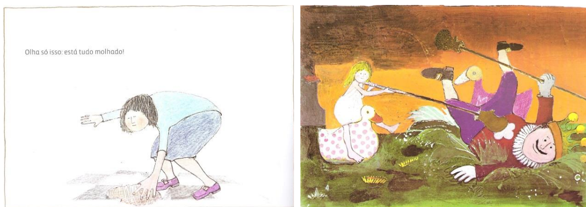
Figura 64: Páginas do livro Hora de sair da banheira, Shirley! de John Burningham, 2011.

Na perspectiva assumida por este trabalho, existe uma prática cultural de leitura que é ensinada/aprendida, permitindo que o leitor se desafie em suas conexões que transitam do esperado ao inesperado, da fantasia à realidade, do literal ao metafórico diante de, por exemplo, narrativas paralelas, como no livro Hora de sair da banheira, Shirley! de John Burningham.