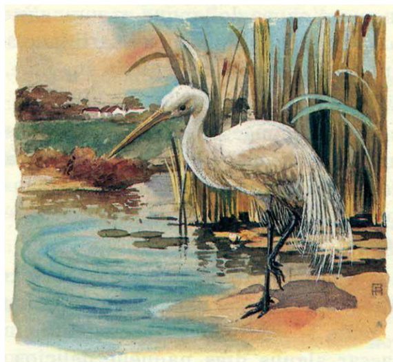
Figura 1: Ilustração do livro O Patinho Feio . Hans Christian Andersen. Weiszflog Irmãos Editores. 1915 3 .