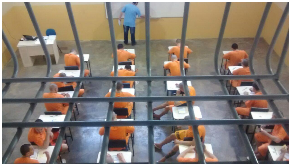
FIGURA 3 – Cela de Aula