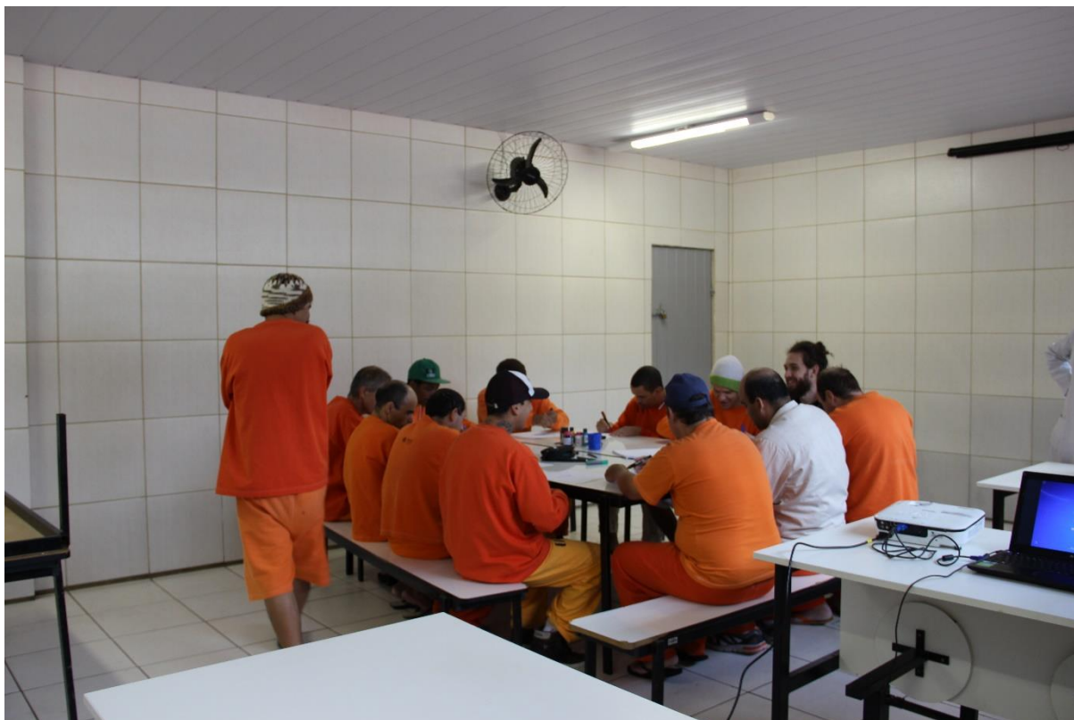
FIGURA 4 – Oficina