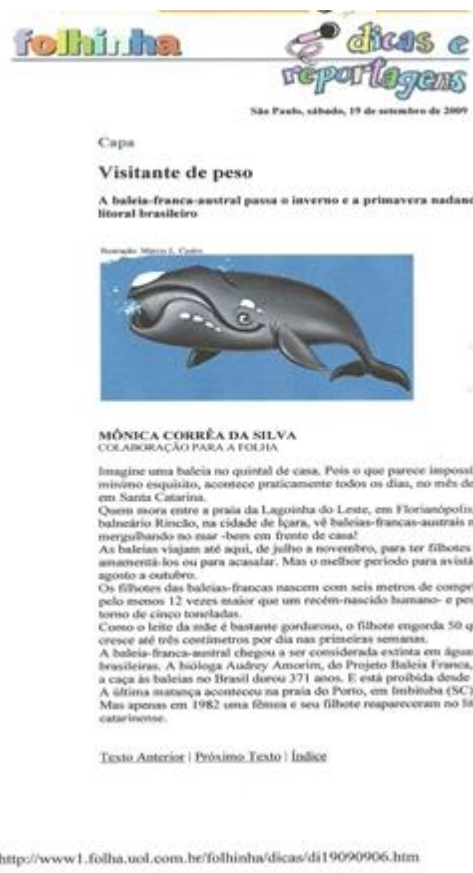
Imagem 2: notícia original 4 extraída da folhinha on-line

Diante dos textos, notamos primeiramente que no livro didático o título da notícia é o original, no entanto, o livro reproduziu parcialmente o texto, pois constam os três primeiros parágrafos da notícia original, sem modificações no interior do trecho, mas as demais informações foram suprimidas por reticências descaracterizando o gênero notícia e alterando o foco da leitura. Ao cortar o texto, o livro didático faz com que a atenção do leitor se volte para o aparecimento das baleias nos mares, enquanto a questão da proibição da caça desse animal fica em segundo plano.