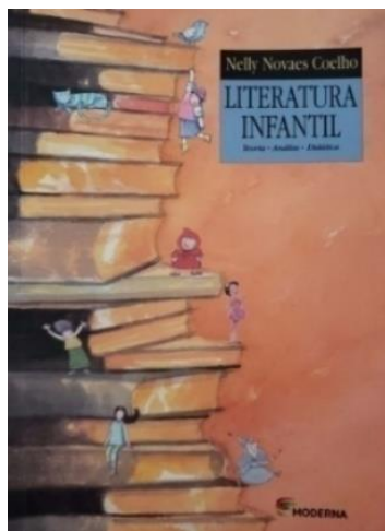
Figura 3: Capa do exemplar da 7ª. edição de A literatura infantil: teoria, análise, didática