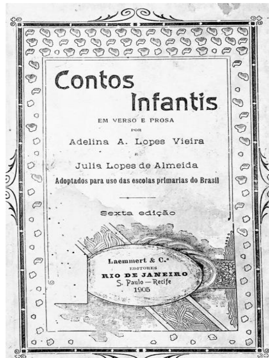
Figura 1: Capa de Contos Infantis – Fonte: Vieira e Almeida, 1905.

A segunda fonte é Histórias da Nossa Terra (figura 2) em sua sexta edição, datada de 1911 e publicada pela livraria Francisco Alves & Cia., de Júlia Lopes de Almeida, que foi produzida em letra de imprensa, possuindo 228 páginas e 69 figuras. Histórias da Nossa Terra é de uma reunião de cartas, contos e anotações de crianças que representam os sexos feminino e masculino.